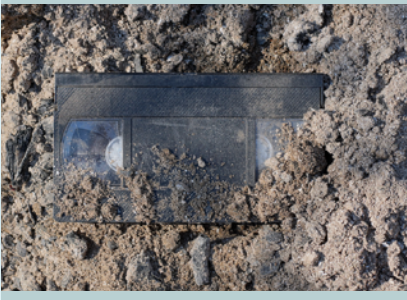
Cintas magnéticas afectadas por el lodo y el barro.