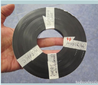
Carrete etiquetado.