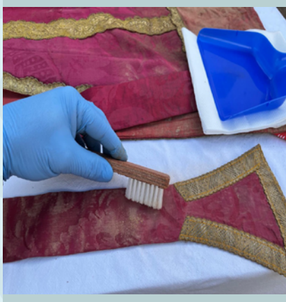
Iglesia de Chiva. DANA de Valencia 2024.