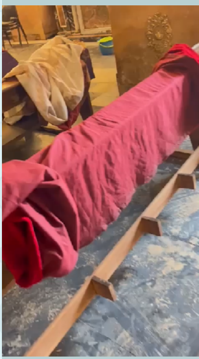
Iglesia de Algemesí afectada por la DANA de Valencia 2024 Vídeo ©Salut Reyes