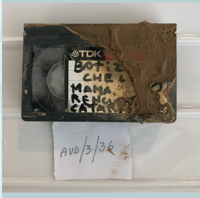
Colección privada de cintas magnéticas afectadas por el lodo. Filmoteca Valencia.